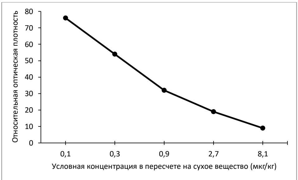
Рис. 1. Пример калибровочной кривой.

По величинам значений относительной оптической плотности, вычисленным для стандартных растворов (п. 10.2.), и соответствующим им значениям концентрации энрофлоксацина в мкг/кг (0; 0,1; 0,3; 0,9; 2,7; 8,1) построить калибровочную кривую в полулогарифмической системе координат (например, рис. 1).